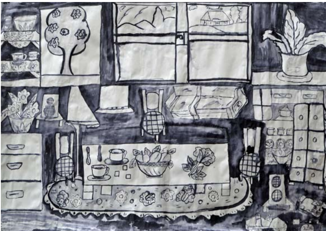
MONIKA HERÁKOVÁ ► Me barvaľipen | lavirovaná kresba

Paradoxne veľkoformátové akvarely pôsobia intímny, komorným dojmom vďaka téme, ktorou je „domácke“ zátíšie. Námetom je prívetivý interiér izby, ktorému nechýba „ženská ruka“. Tak trochu plošne, symbolicky a ilustratívne autorka vyjadrila prostredie plné osobných domácich domov tvoriacich reálií – kvetináče s izbovými rastlinami, pestrý koberček pod stolíkom obklopenom stoličkami, pohovkou, nábytkom, oknom s výhľadom. V centre kompozície je umiestnený stôl s kávovými šálkami s kockovým cukrom. Tieto obrazy vyjadrujú domov.