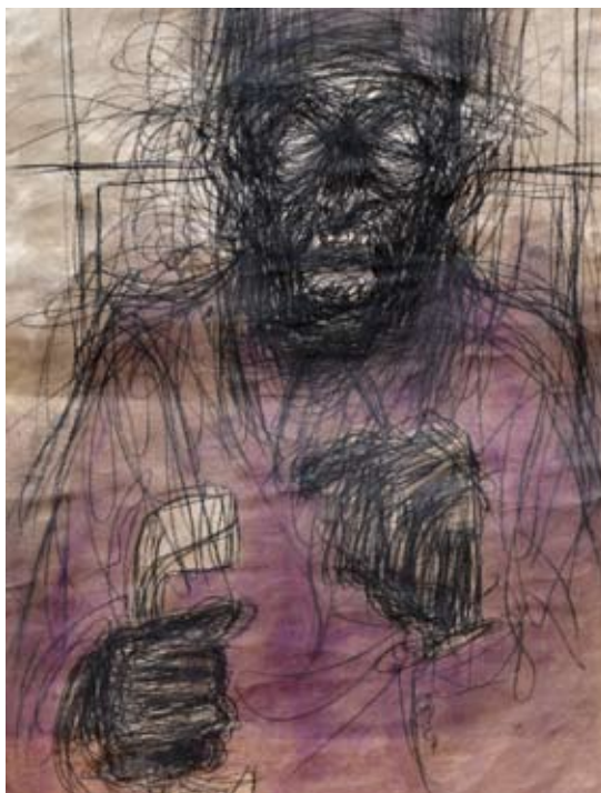
ALEŠ PORUBSKÝ ► Muž, Pápež s telefónom | kresba uhlom, olej

Predovšetkým expresívna lineárna kresba uhlíkom je hlavným nositeľom výrazu práce autora, ktorý rozvíja žáner portrétnej tvorby. Tímená lazúrna farebná plocha dopĺňa stredovú kompozíciu a pomáha akcentovať gesto rúk a zvýrazňuje figúru v priestore.