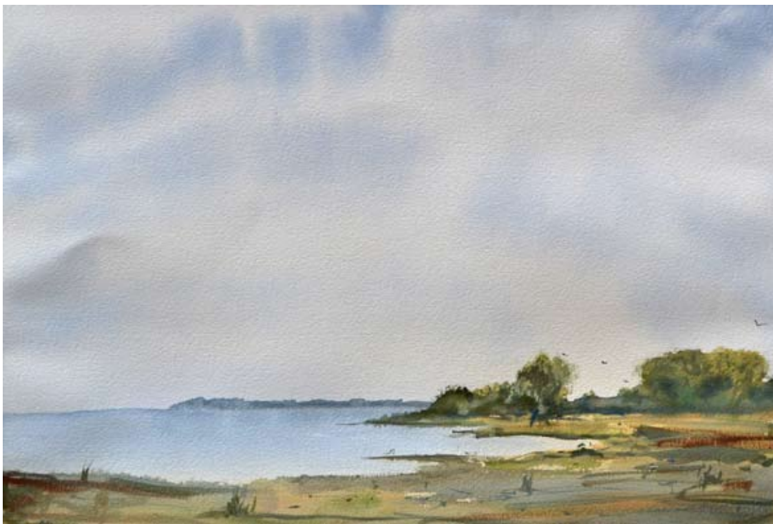
ANNA HLADKÁ ► Krajina | akvarel

Jednoduchosť, ba až prostý názov Krajina vystihuje skromnosť námetu „obyčajnej“ krajiny, ktorá je v ostrom kontraste s tým, akým spôsobom je akvarel realizovaný. Dve tretiny kompozície tvorí obloha, ktorá obsahuje doslovne vodou nabitú mračno nenápadne a jemne naznačené v rozptýlenom svetle. Za atmosférou oblohy nijako nezaostáva spracovanie horizontu, vodnej hladiny a zátoky s náznakom drobného porastu. V detaile sú to abstraktné gestá a ťahy štetca, ktoré pôsobia veľmi sviežo, dynamicky.