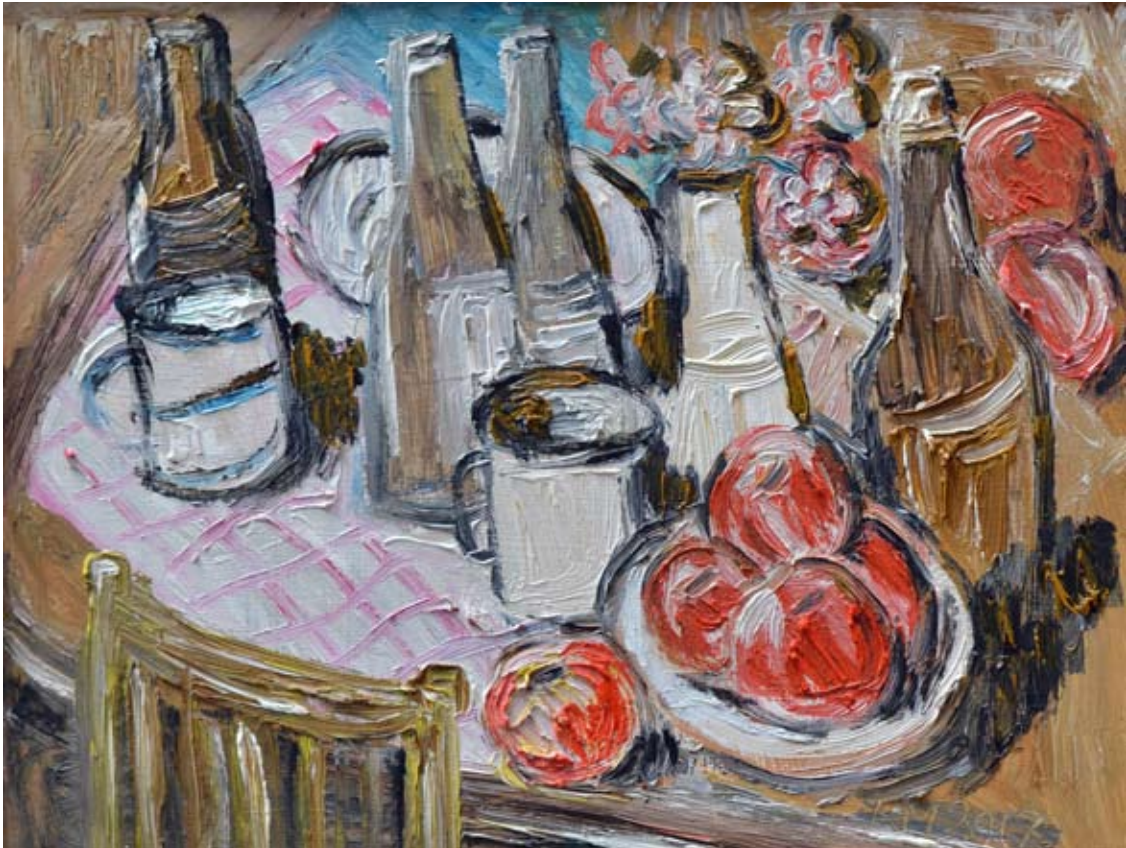
KAROL MATEJKA ► Zátišie | olej

Pôvodne chaotickej kompozícii tvorenej veľkým množstvom predmetov dodáva expresívny charakter maliarsky prejav autora realizovaný pastóznym štýlom maľby. Nositeľom expresívneho výrazu je masa farby a nie samotná farebnosť. Živosť a dynamiku obrazu dodáva výrazná a hrubá čierna kontúra, ktorá zabezpečuje tmavú zložku obrazu miestami tmenú bielou farbou. Naopak, koloristicky je obraz veľmi strohý, ba až grafický. Modeláciu čiernou a bielou dopĺňa jemne studená krapľaková červená zjemnená teplými tónmi okrovej a žltej farby.