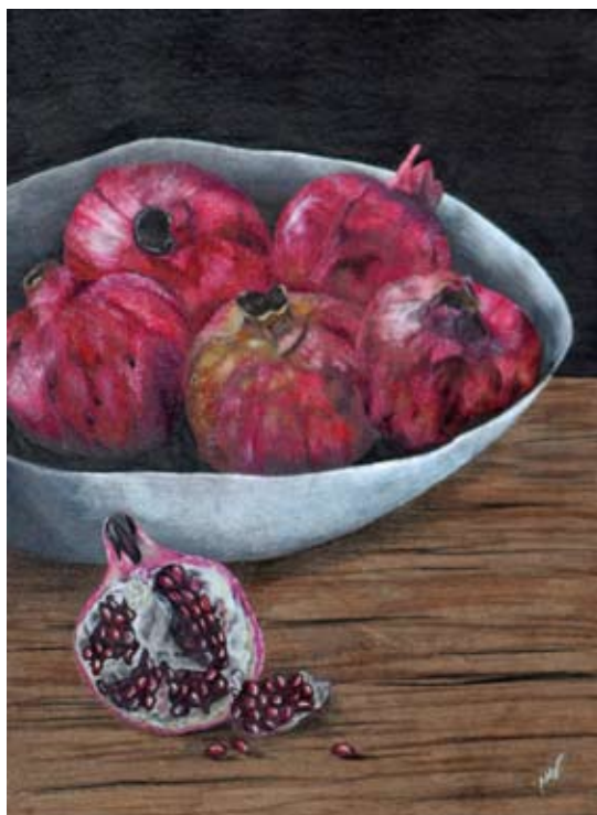
MICHAELA RÓNAIOVÁ ► Broskyne na dreve, Granátové jablká v miske | kresba

Základom výrazu štúdií zátiší s ovocím je využitie čierneho papiera ako podkladu kresby, ktorá je realizovaná v štýle fotorealizmu. Svetlé farebné červené, žlté a biele akcenty vystupujú „z tieňa“, čo silno pripomína štýl holandských zátiší, ktoré autorka obohatila o netradičný uhol pohľadu, tak trochu fotografický až hyperrealistický štýl zobrazenia.